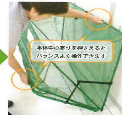
②一番上のフレームを押さえながら一番下のフレームを広げます。