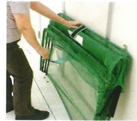
①ベルトを外して本体を広げます。

収集場所に設置してありますこのネットの中にゴミを出して下さい。尚、一番にゴミを出す方はお手数ですが、下図のように設置後、ご利用いただきますよう、お願い致します。