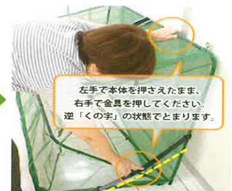
③ストッパーを押して本体を逆「く」の状態とまります。